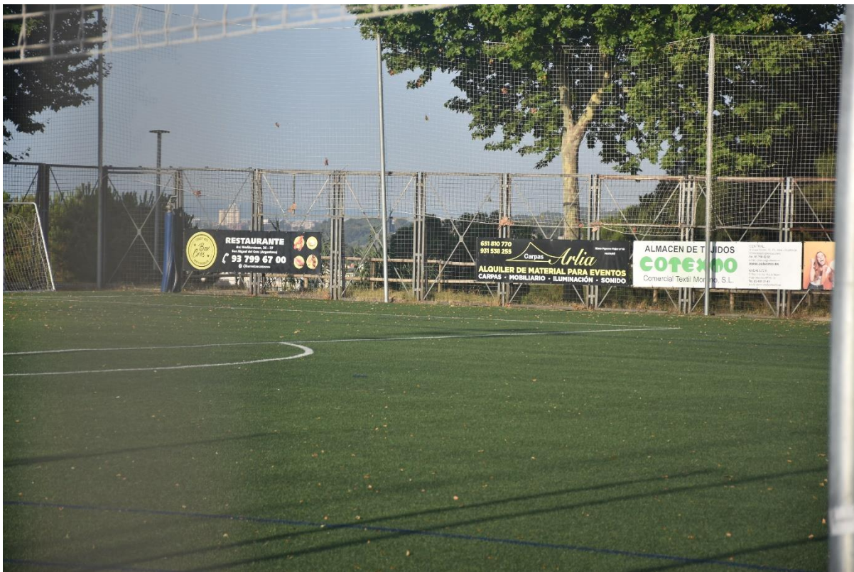
Figura 7: Instalación publicitaria en el campo de U.D. Molinos