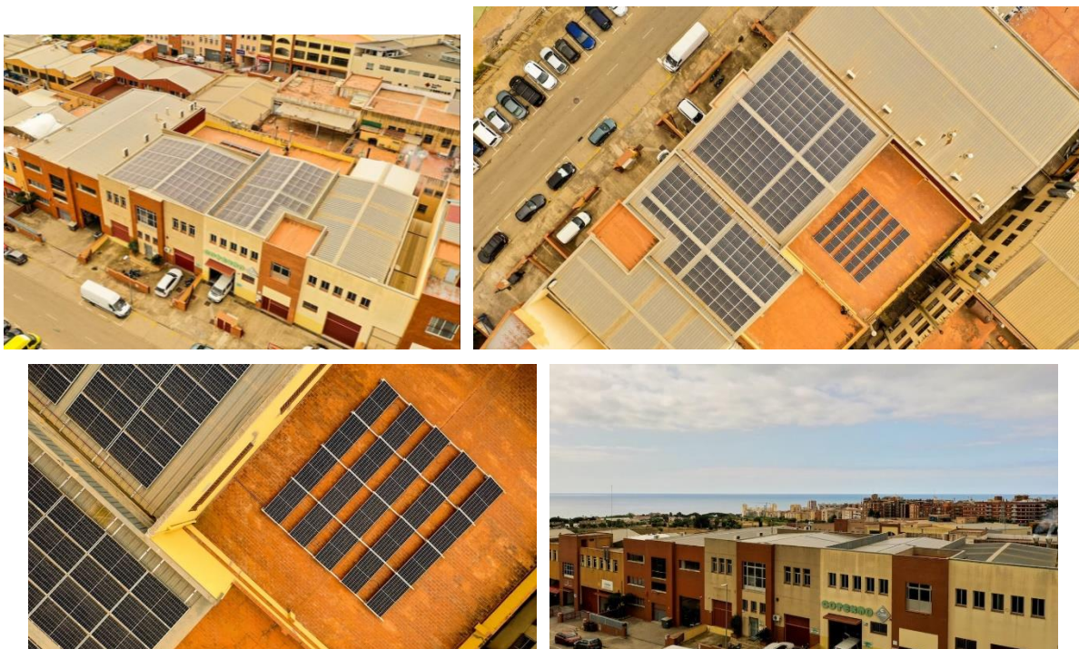
Figura 2: Imágenes aéreas de la instalación (Felper).

Durante el primer trimestre del 2022, se realizó la instalación de paneles solares para autoconsumo industrial en la empresa Megapunt, de tejeduría. Se han instalado 132 paneles solares (Figura 2) con una potencia de 455 W y una potencia pico total de 60,06 Kw.