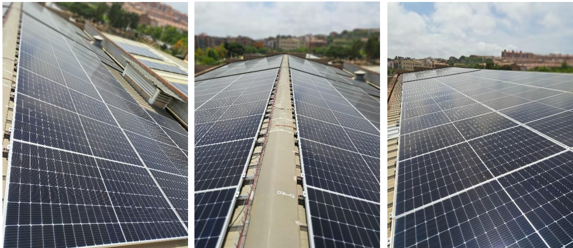
Figura 4: Imágenes aéreas de la instalación (Megapunt).